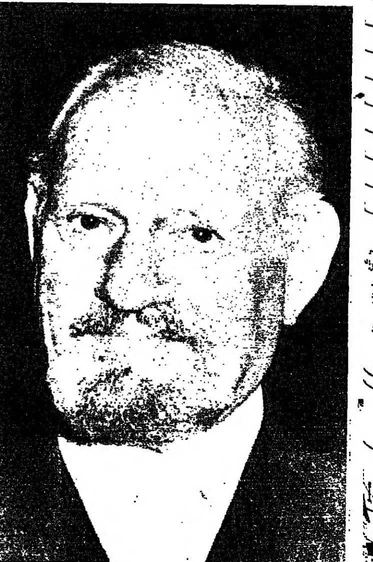
هارى اندروز، الممثل البريطاني الكبير، الذي عرف بدوره العسكري، توفي امس الاول في لندن عن ٧٧ عاماً. اندروز كان لاعب دور والد بلايك كارينغتون في المسلسل الاميركي «دايسني».